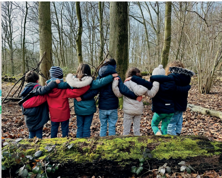
Ateliers en petits groupes