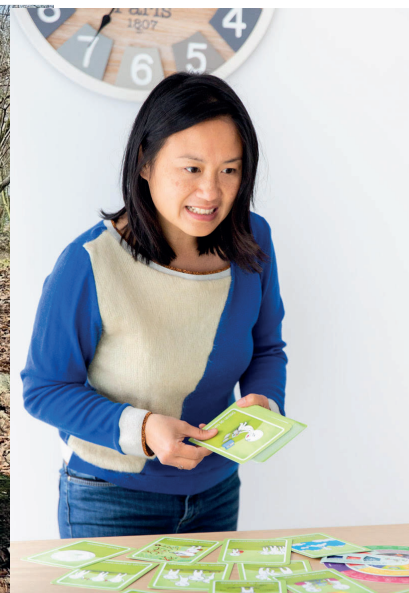
Accompagnement des écoles

LAISSONS LES ENFANTS NOUS INSPIRER AVEC LEUR JOIE DE VIVRE, LEUR SENSIBILITÉ ET LEUR SINCÉRITÉ.